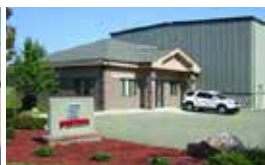
Michigan / USA