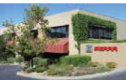
Californie / USA