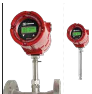
Steeltrak® / SteelMass®